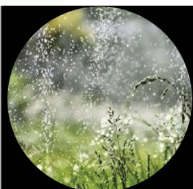
Riego de jardines