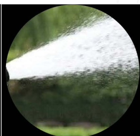
Riego de tierras agrícolas