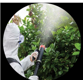
Nebulización de árboles