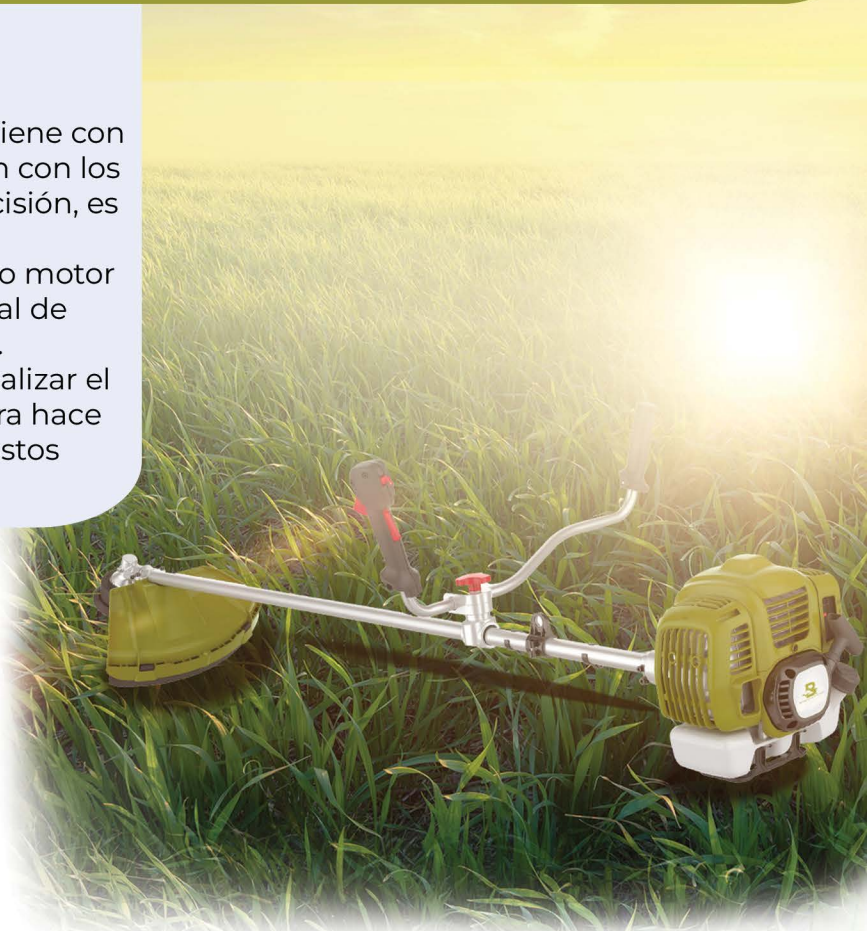
Cortador de caña de azúcar