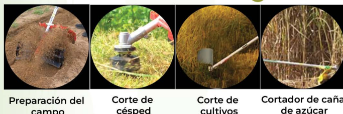
Preparación del campo