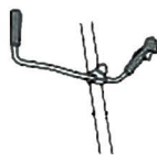
Mango plegable para fácil almacenamiento